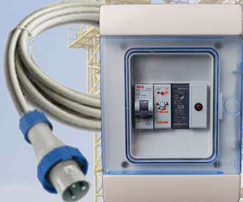
CENTRALINA GESTIONE LUCI DI SICUREZZA 12V